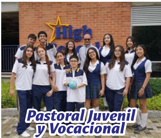
Pastoral Juvenil y Vocacional