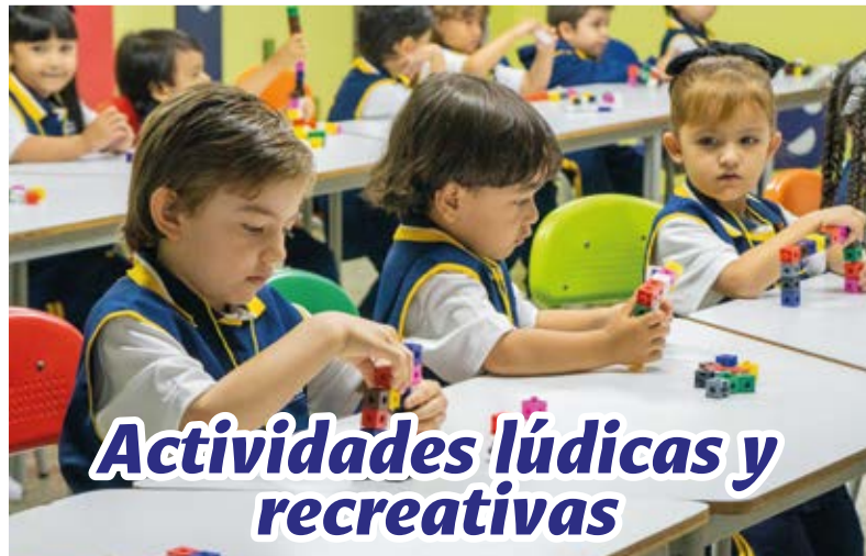
Actividades lúdicas y recreativas