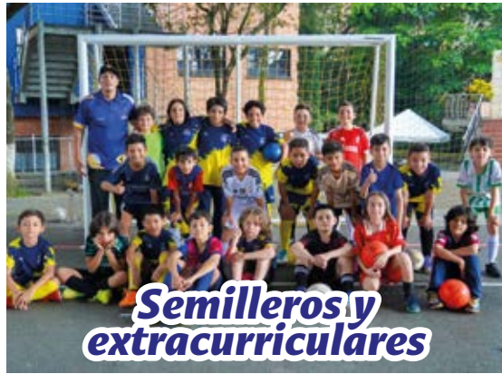
Semilleros y extracurriculares