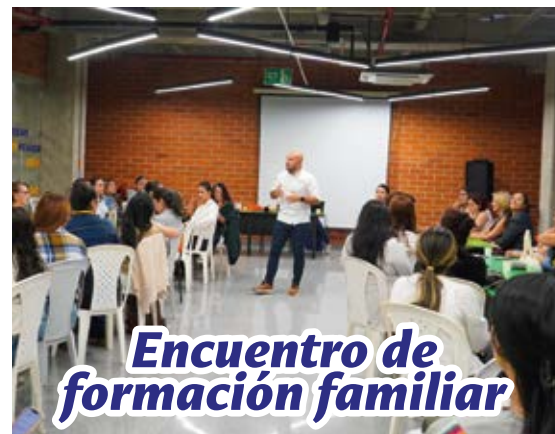
Encuentro de formación familiar