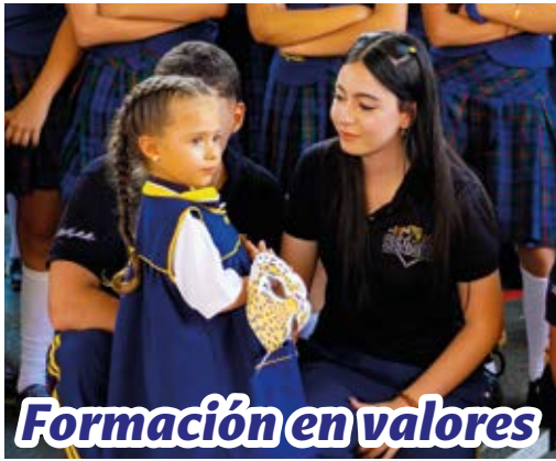
Formación en valores