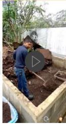
Aprovechamiento de los recursos, para la siembra.