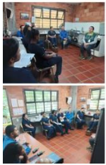
Formación en reciclaje y uso de los recursos orgánicos del colegio (Ene-junio)

✓ 4.2 Definir criterios de uso eficiente de los recursos en la Institución para contribuir al cuidado del medio ambiente.