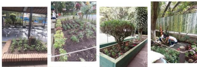
110 mt2 de recuperación de espacios para Jardín.