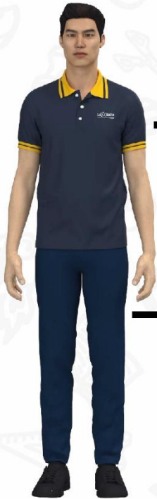
Camiseta diario masculina

Talla 4/18-$53.000,00 Talla S/XL-$57.000,00